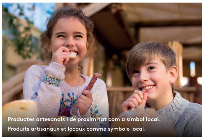
Productes artesanals i de proximitat com a símbol local. Produits artisanaux et locaux comme symbole local.