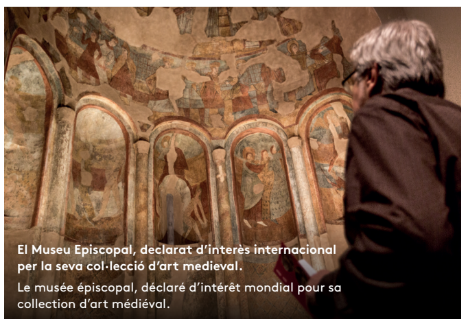
El Museu Episcopal, declarat d'interès internacional per la seva col·lecció d'art medieval. Le musée épiscopal, déclaré d'intérêt mondial pour sa collection d'art médiéval.