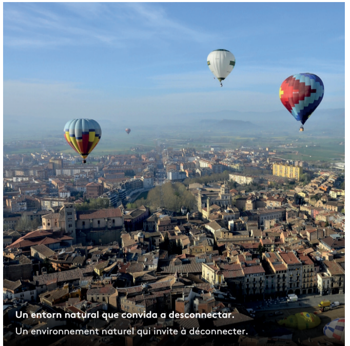
Un entorn natural que convida a desconectar. Un environnement naturel qui invite à déconnecter.

Vic, capitale de la région d'Osona, est située dans un environnement rural où l'activité humaine traditionnelle cohabite avec la nature. De par ses conditions géographiques, la plaine de Vic est un endroit idéal pour les vols en ballon et c'est le point de passage de nombreux sentiers de grande randonnée et de parcours en VTT.