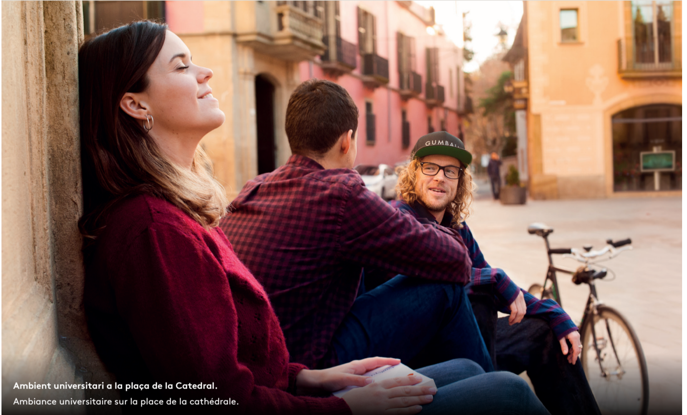
Ambient universitari a la plaça de la Catedral. Ambiance universitaire sur la place de la cathédrale.

À vélo ou à pied, à deux ou en famille, Vic est une ville conçue par et pour les personnes.