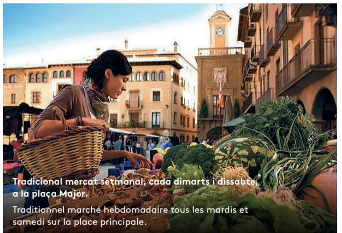
Tradicional mercat setmanal, cada dimarts i dissabte, a la plaça Major. Traditionnel marché hebdomadaire tous les mardis et samedi sur la place principale.

Le centre historique, d'origine médiévale, inclut un temple romain ainsi que des bâtiments remarquables de l'époque contemporaine. Les collections d'art roman et gothique du musée épiscopal sont parmi les plus belles d'Europe et du monde. L'œuvre la plus connue du peintre J.M. Sert (1874-1945) décore la cathédrale, à côté du clocher roman et du cloître gothique. Aujourd'hui, Vic est une ville universitaire avec un complexe pour les arts scéniques et les études musicales, ainsi que de nombreuses entités qui lui apportent une grande vitalité culturelle.