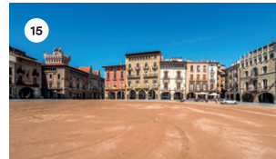
15 PLAÇA MAJOR PIANO DE L'EMVIC DS, 17 LLIURE DG, 18 LLIURE