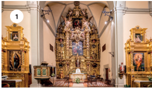
1 CONVENT DE SANTA TERESA JORDI DOMÈNECH DG, 18 11 | 12 | 13 h