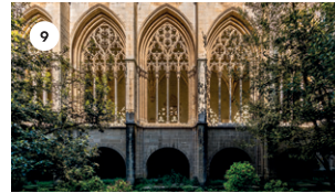
9 CLAUSTRE DE LA CATEDRAL COR JOVE DE L'EMVIC DS, 17 18 | 19 | 20 h DG, 18 11 | 12 | 13 h