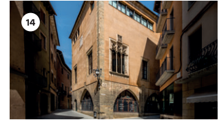
14 FINESTRAL DE L'AJUNTAMENT PAULA VALLS DS, 17 18 | 19 | 20 h DG, 18 11 | 12 | 13 | 18 | 19 | 20 h