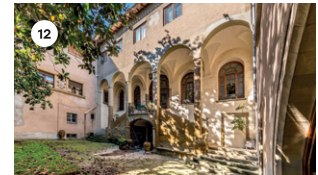
12 HOSPITAL DE LA SANTA CREU MUCHACHO & LOS SOBRINOS DS, 17 18 | 19 | 20 h DG, 18 11 | 12 | 13 | 18 | 19 | 20 h