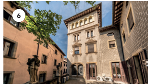
6 CASA MASFERRER GERMÀ AIRE DS, 17 18.30 | 19.30 | 20.30 h GUILLEM ROMA I GEMMA ABRÍE DG, 18 11.30 | 12.30 | 13.30 h 18.30 | 19.30 | 20.30 h