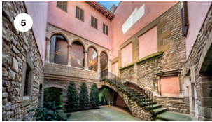
5 CASA CLARIANA PEP POBLET DS, 17 18 | 19 | 20 h DG, 18 11 | 12 | 13 | 18 | 19 | 20 h