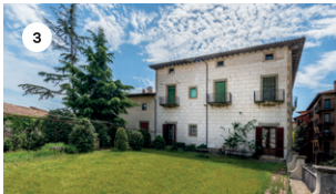
3 CASA PARRELLA (JARDÍ) JAZZ BAND DE L'EMVIC DS, 17 18 | 19 | 20 h DG, 18 11 | 12 | 13 | 18 | 19 | 20 h