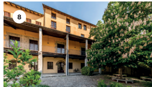
8 CASA BOJONS CORAL CANIGÓ DS, 17 18.30 | 19.30 | 20.30 h LABORATORI DE VENT DE L'EMVIC DG, 18 11.30 | 12.30 | 13.30 h COR CABIROL DG, 18 18.30 | 19.30 | 20.30 h