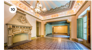
10 CASA RICART (MENJADOR) CONJUNT DE CLARINETS DE L'EMVIC DS, 17 18 | 19 | 20 h 20.45 h concert OCV ORQUESTRA DE CAMBRA DE VIC DG, 18 11 | 12 | 13 | 18 | 19 | 20 h