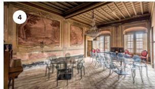
4 CASA PRAT DAVID VIÑOLAS DS, 17 18 | 18.30 h DG, 18 11 | 11.30 | 18 | 18.30 h