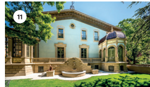
11 CASA RICART (JARDÍ) MAR VILASECA I JOAN FORT DS, 17 18.30 | 19.30 | 20.30 h DG, 18 11.30 | 12.30 | 13.30 h 18.30 | 19.30 | 20.30 h