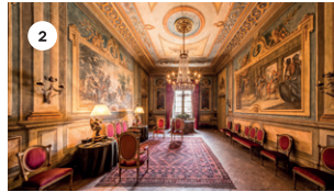
2 CASA PARRELLA (MENJADOR) CATI REUS I JOEL BARDOLET DS, 17 18.30 | 19.30 | 20.30 h DG, 18 11.30 | 12.30 | 13.30 h 18.30 | 19.30 | 20.30 h