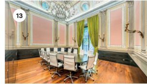
13 CASA ROCAFIGUERA JORDI DOMÈNECH DS, 17 18 | 19 | 20 h XY DG, 18 11 | 12 | 13 | 18 | 19 | 20 h